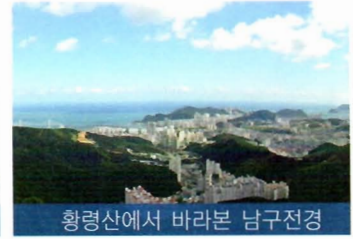
황령산에서 바라본 남구전경