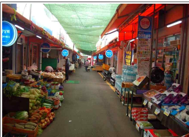
〈비가림막 설치 전〉